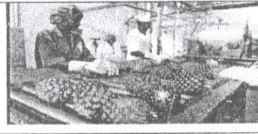
Doc 2 : production agricole, matière première pour le développement industrielle